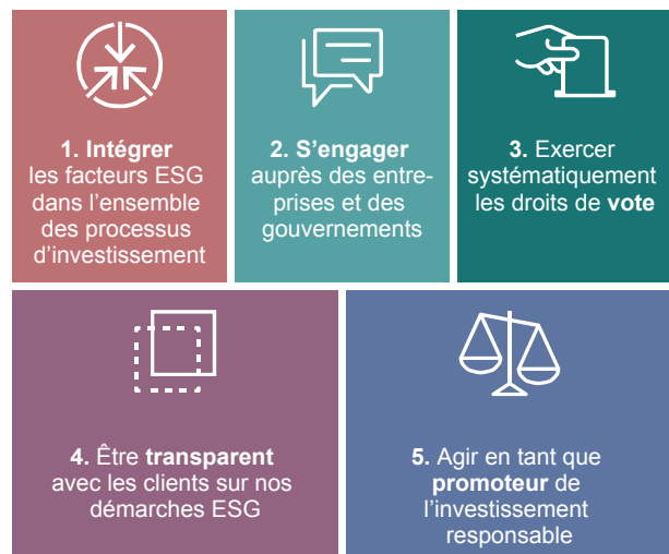
Illustration 1

Pictet Asset Management travaille selon l’approche suivante: